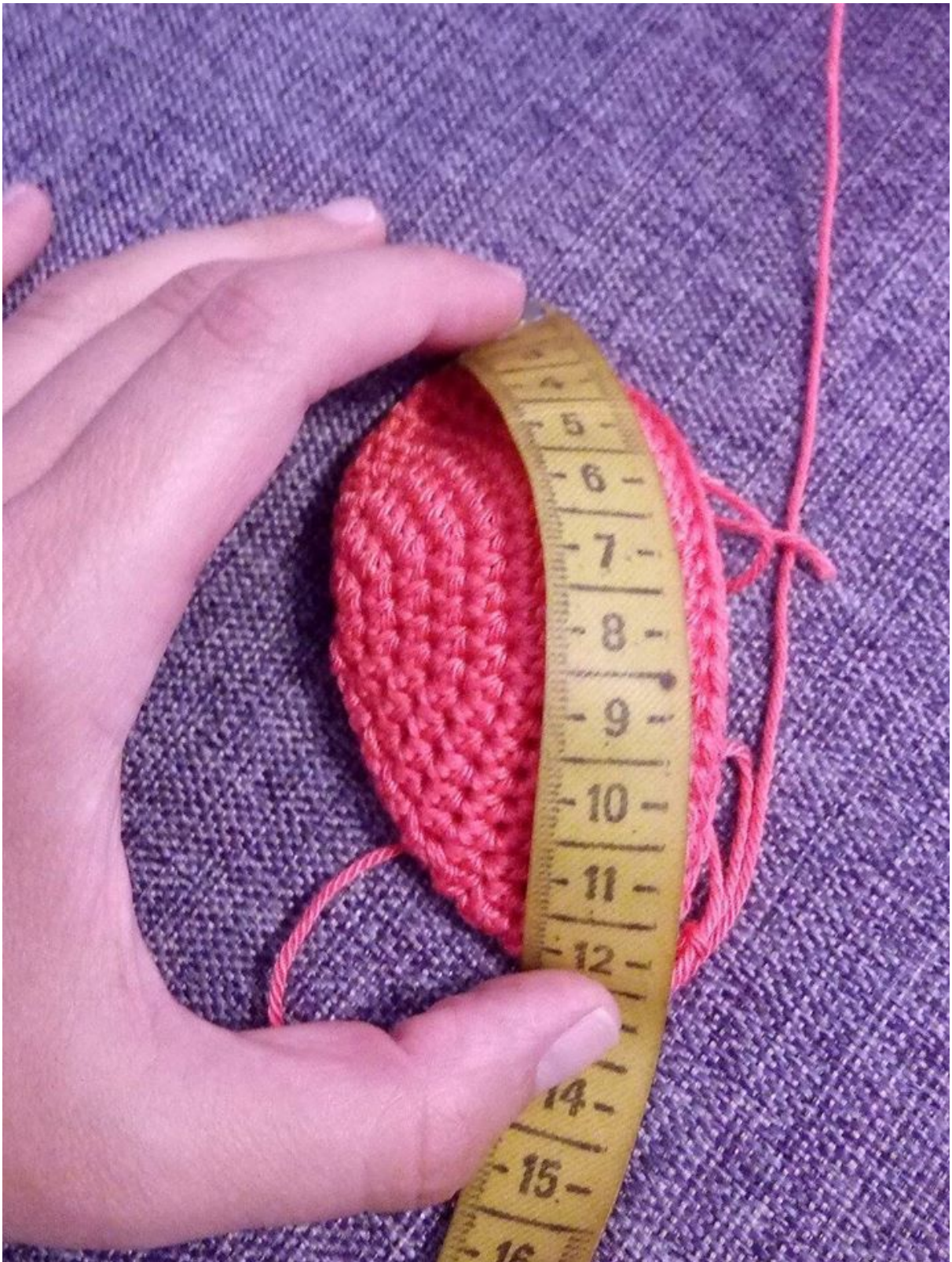
Проверка на Обиколка на шапка