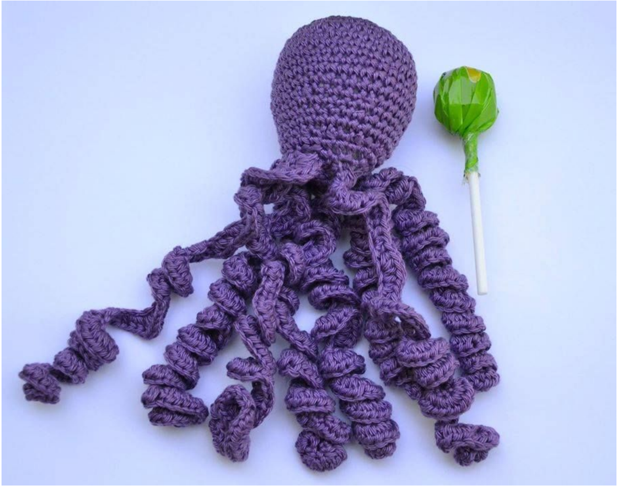
Тест с близалка за тестване на плътността на плетката